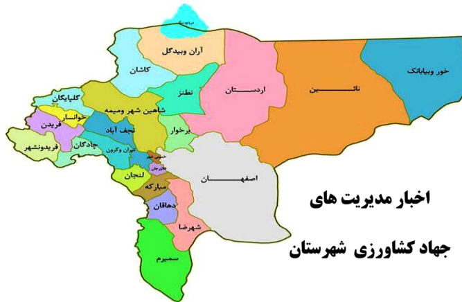
اخبار مدیریت های جهاد کشاورزی شهرستان